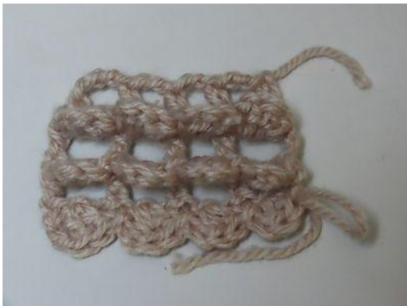
表から見た状態の段々編み